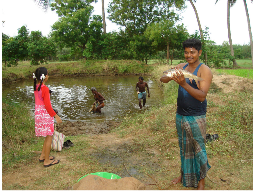
Vis vangen in de vijver op Thiru valagum Farm

ook weer op peil komen met regenwater, want we gaan aan ons tweede seizoen beginnen. De vijver is met veel plezier leeggevist en bracht zo'n 50 kg mooie vis op, grotendeels kado gedaan aan onze projectleden.