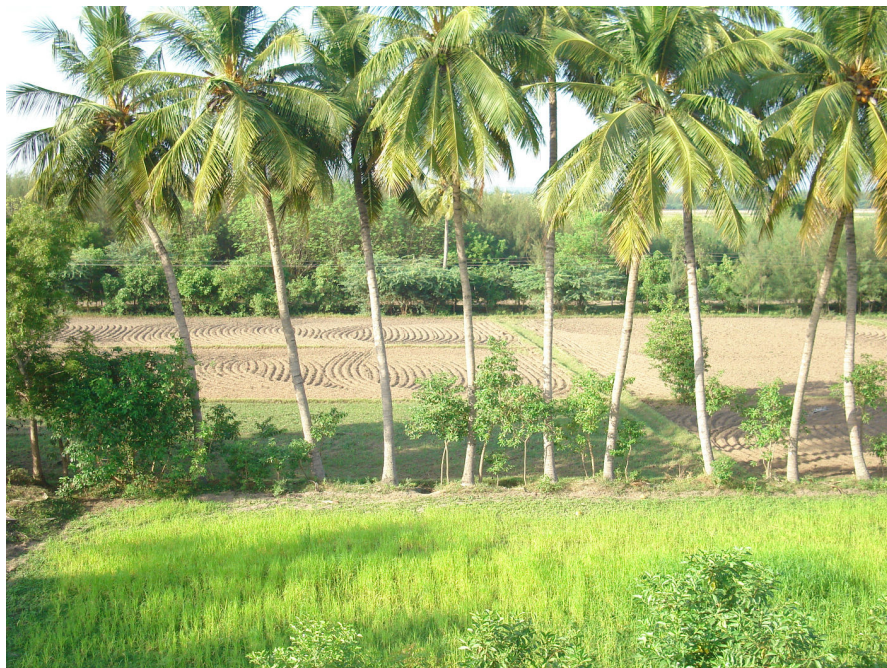
Akkers en cocosbomen op Thiru valagum Farm