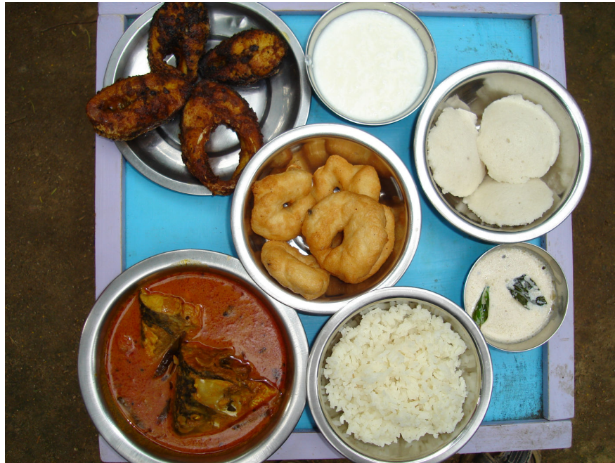
Maaltijd met ingrediënten van Thiru valagum Farm