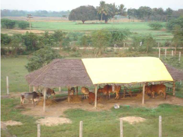
Vee in de oude stal